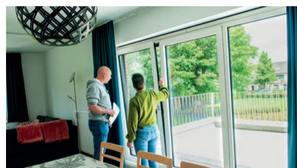
Bezoek van technisch medewerker tijdens de opzegtermijn

Is alles in orde? Dan krijg je je huurwaarborg terug. De kost van de plaatsbeschrijving (€ 42 in 2026) wordt van de waarborg afgehouden. Tijdens de plaatsbeschrijving geef je de sleutels af. Samen noteren we de meterstanden van gas, water en elektriciteit.