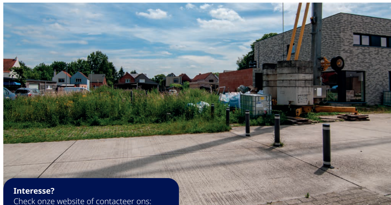
De 2 laatste bouwgronden in Balen