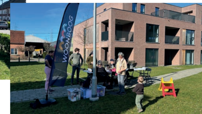
Emiel Becquaertlaan Mol